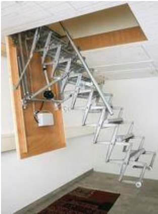
Escalier avec commande électrique