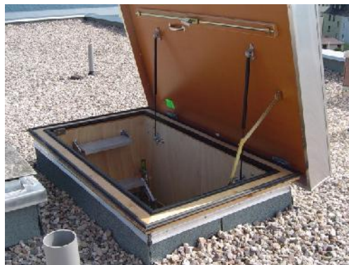
Toegang tot plat dak